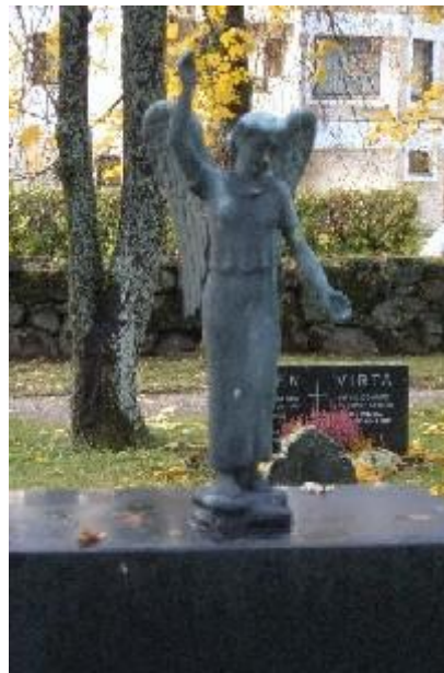
Pojan rintakuva ja enkeliveistos.