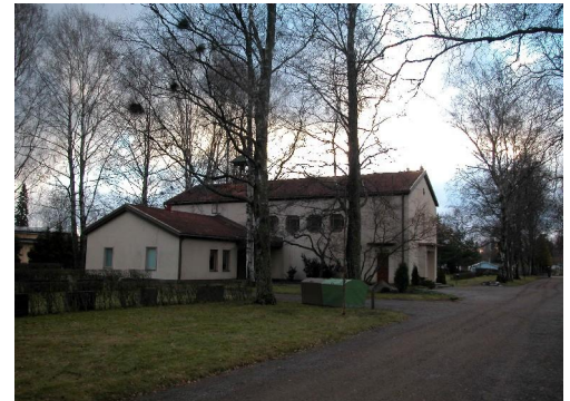
Huutijärven siunauskappeli.

Huutijärven hautausmaa sijaitsee n. 2,5 km Kangasalan keskustasta kaakkoon päin. Se perustettiin 1930 ja laajennusten jälkeen hautausmaan alue on nyt 4,3 ha. Orapihlaja-aidan rajaaman hautausmaa-alueen pääsisäänkäynti on eteläsivulla Jokioistentiellä. (kuva 1316/24) Suorakulmaisen hautausmaan halkaisee pohjois-eteläsuunnassa koivuin reunustettu leveä hiekkakäytävä, joka ulottuu portilta portille. (kuva 1316/31) Käytävän varrella oikealla sijaitsee 1940 käyttöön vihitty Arvo Eräsen suunnittelema vaaleaksi rapattu siunauskappeli. Hautausmaa-alueen luoteiskulmassa pensas-aidan takana on punaiseksi maalattu puinen seurakuntasali ja ruskeaksi maalattu puinen huoltorakennus.